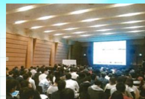
以前開催時の様子